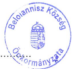
Papalexisz Kosztasz polgármester